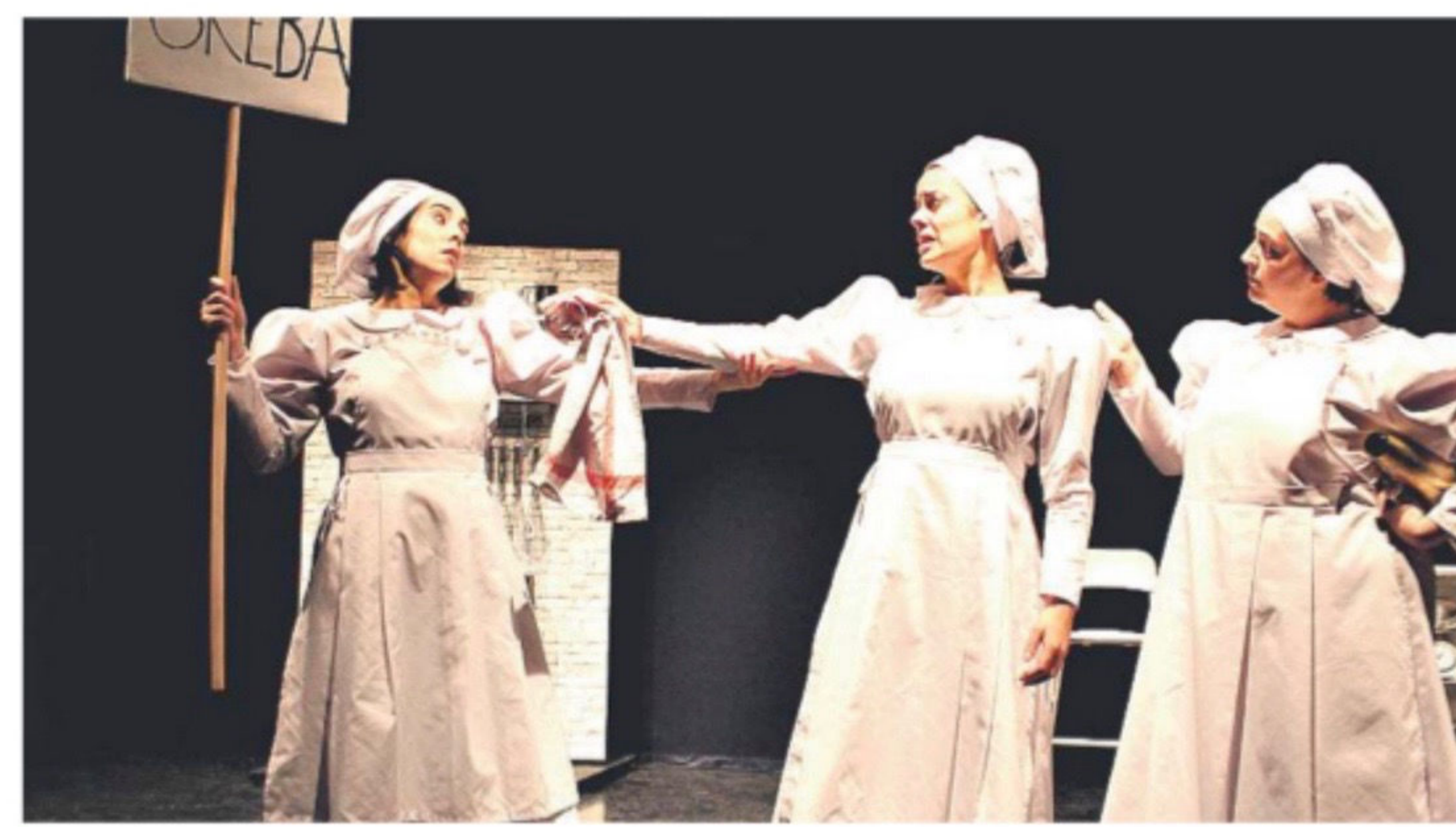
● Gaileta fabrika eta etxea dira antzezlano agertoki nagusiak. EIDABE

Lukaren ama ere andre langilea da. Haren lan baldintzek ere badute gazitik, amonarekin bezala: «Alabarekin egon nahi du, baina ez du denborarik topatzen horretarako. Azkenean, nekatu eta bere bizitza-